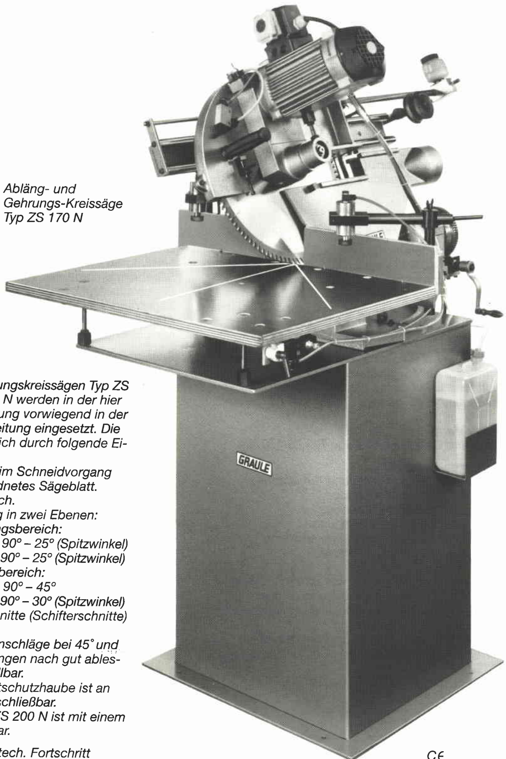
Abb: Abläng- und Gehrungs-Kreissäge Typ ZS 170 N

Die Abläng- und Gehrungskreissägen Typ ZS 170 N und Typ ZS 200 N werden in der hier abgebildeten Ausstattung vorwiegend in der Aluminiumprofilbearbeitung eingesetzt. Die Maschinen zeichnen sich durch folgende Eigenschaften aus: